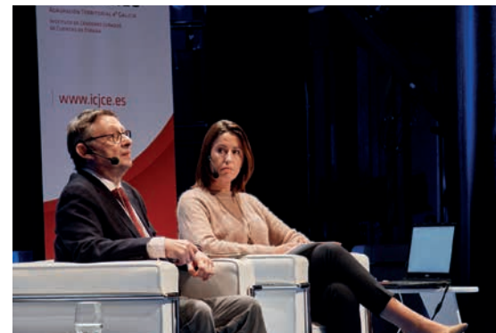
Reconocimiento de ingresos

El primero de los temas que salió a la palestra fue el de la actual situación del sector. En este sentido, Durán, señaló que cada vez detecta un mayor reconocimiento a los profes-