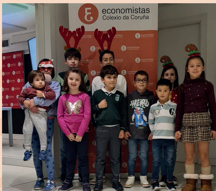
Los menores que pudieron acudir a la cita posan antes de la entrega de premios