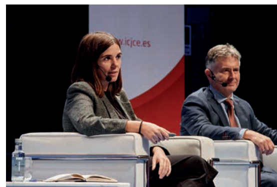
Detección de fraude e IA