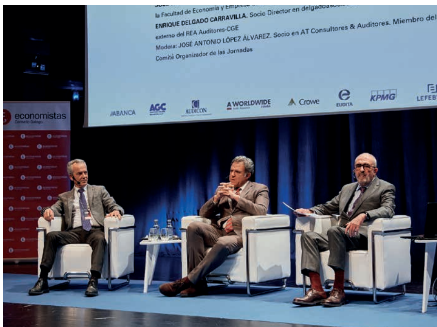
Riesgo de continuidad de una firma de auditoría

Finalizó de este modo una nueva edición de unas Jornadas que, como viene siendo habitual, sirvieron tanto como formación de reciclaje en auditoría y contabilidad como para realizar una puesta en común y de reflexión y debate sobre los problemas, soluciones y retos que ambos sectores deben de enfrentar a corto y medio plazo.