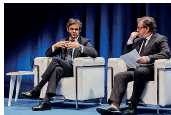
Actuaciones del experto independiente en el ámbito mercantil