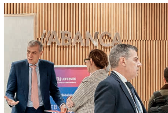
El Auditoria Abanca de Santiago de Compostela volvió a ser la sede del evento