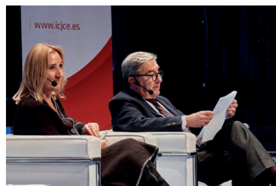
Normas de Elaboración de Informes de Sostenibilidad