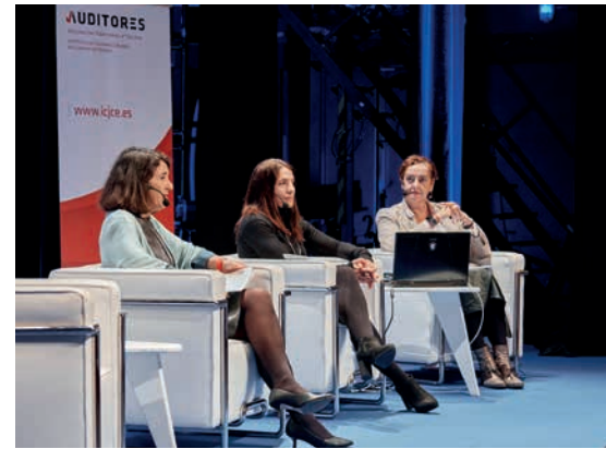
Novedades técnicas y normativas y deficiencias en las revisiones del ICAC

Con el foco en la sostenibilidad y la inteligencia artificial, entre otros asuntos, el pasado día 12 de diciembre, tuvo lugar una nueva edición de las Jornadas de Auditoría y Contabilidad en Galicia, que no solo brindó una oportunidad para obtener información directa sobre las últimas novedades en ambos sectores, sino que también buscó adelantarse a los desafíos y tendencias que influirán en el futuro de la auditoría y la contabilidad en el medio plazo.