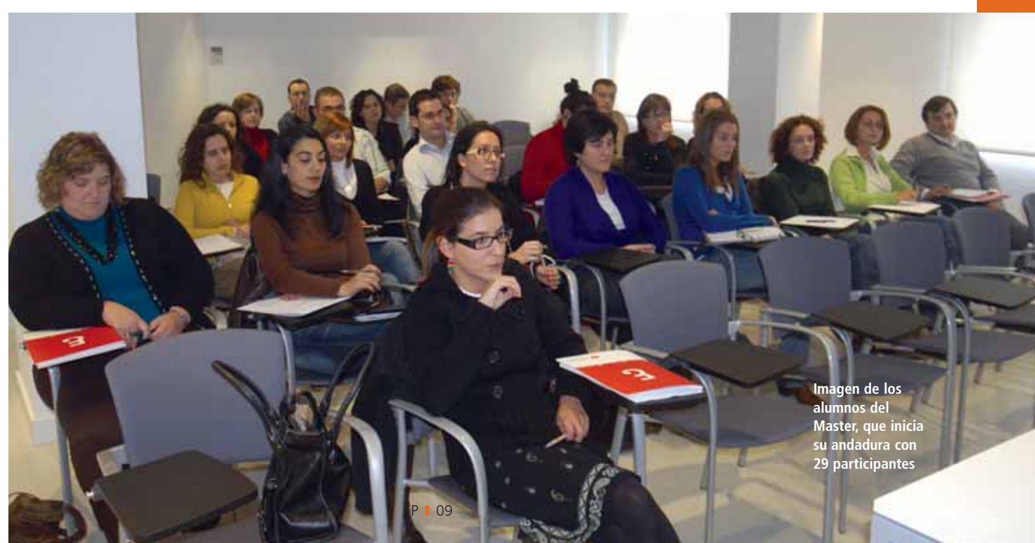
Imagen de los alumnos del Master, que inicia su andadura con 29 participantes